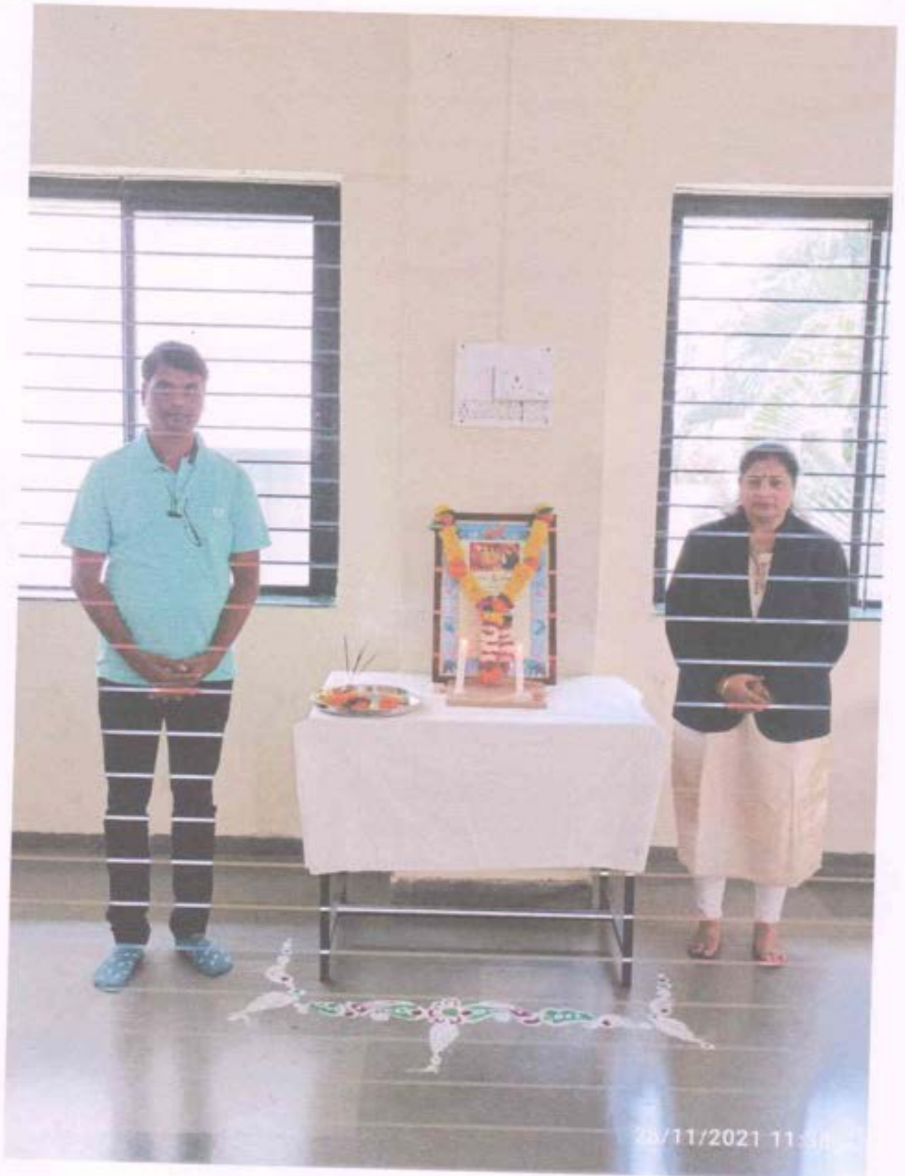
Glimpses of Celebration of "Samvidhan Din"