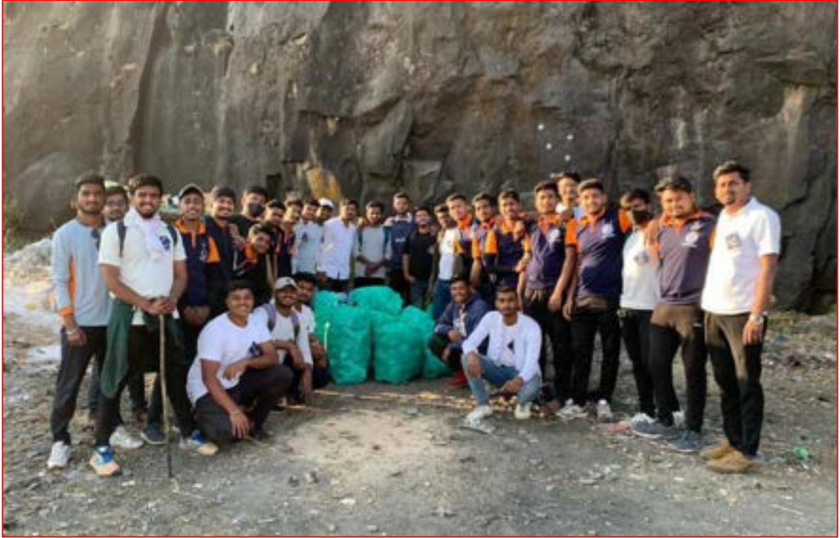
'Gad Swachhata Mohim' at Sinhgad Fort on 14 Feb 2022