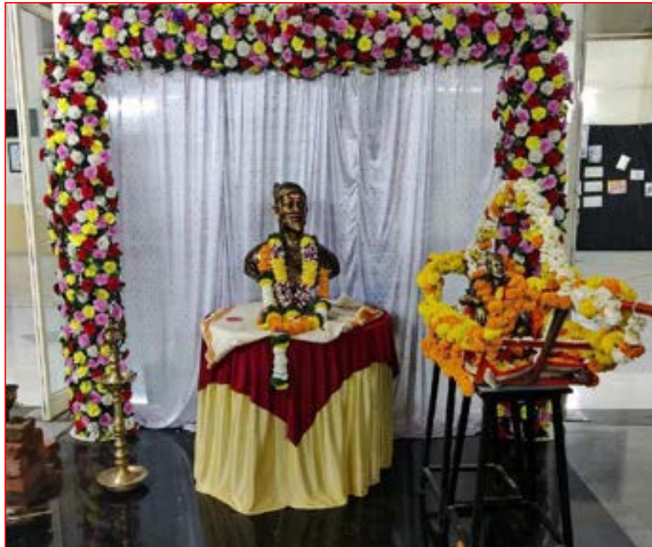
Shivjayanti Decoration and 'Palkhi' at MMIT Campus