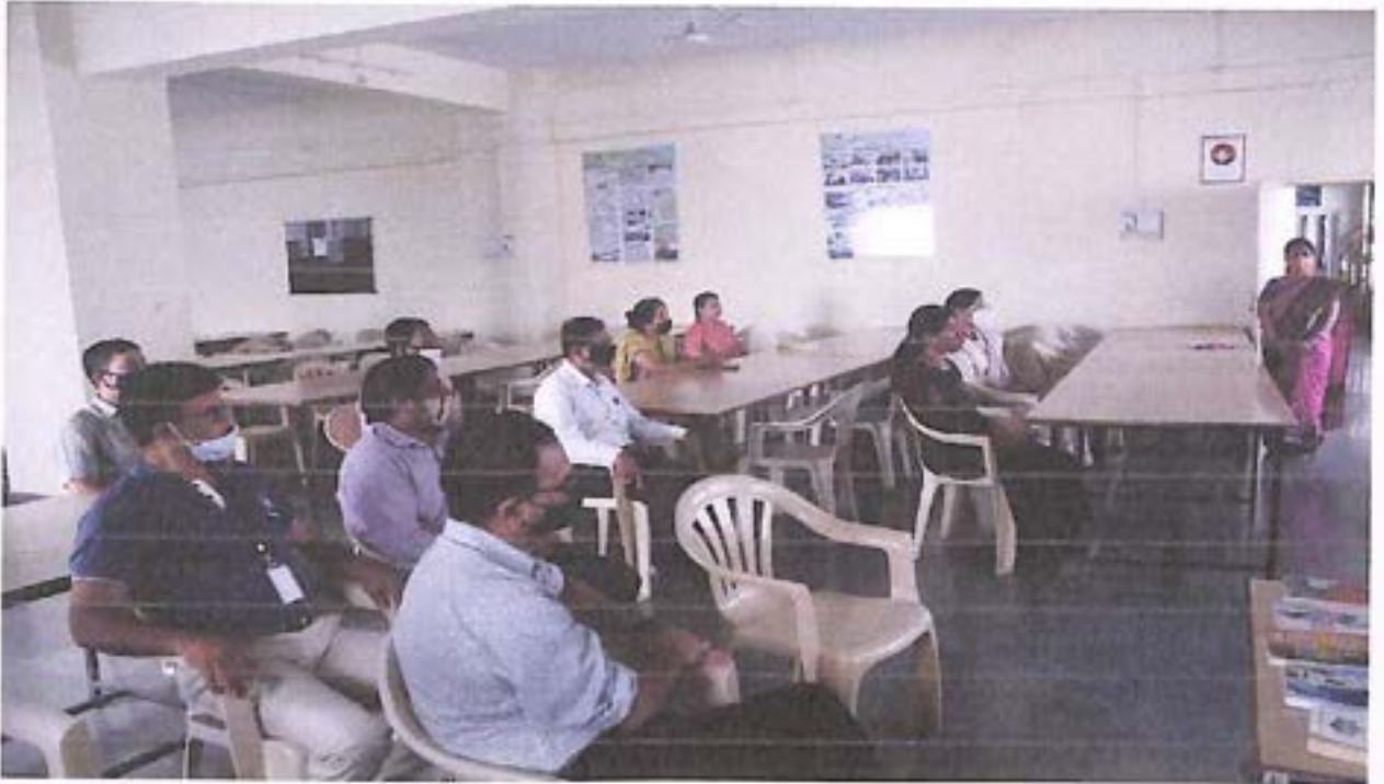
Staff attending the Programme.