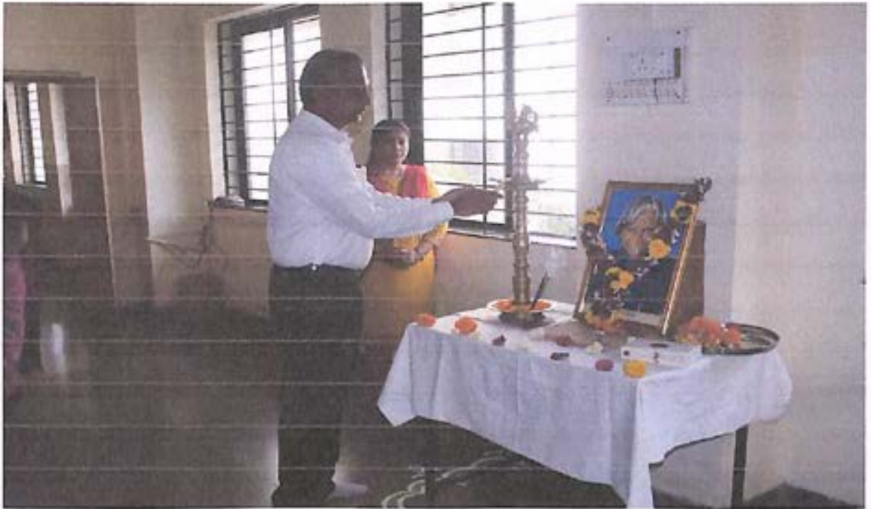
Lightning the lamp and garlanding A. P. J. Abdul Kalam's photo.