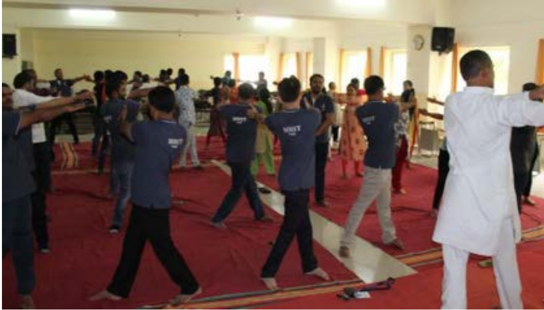
NSS Programme Officer